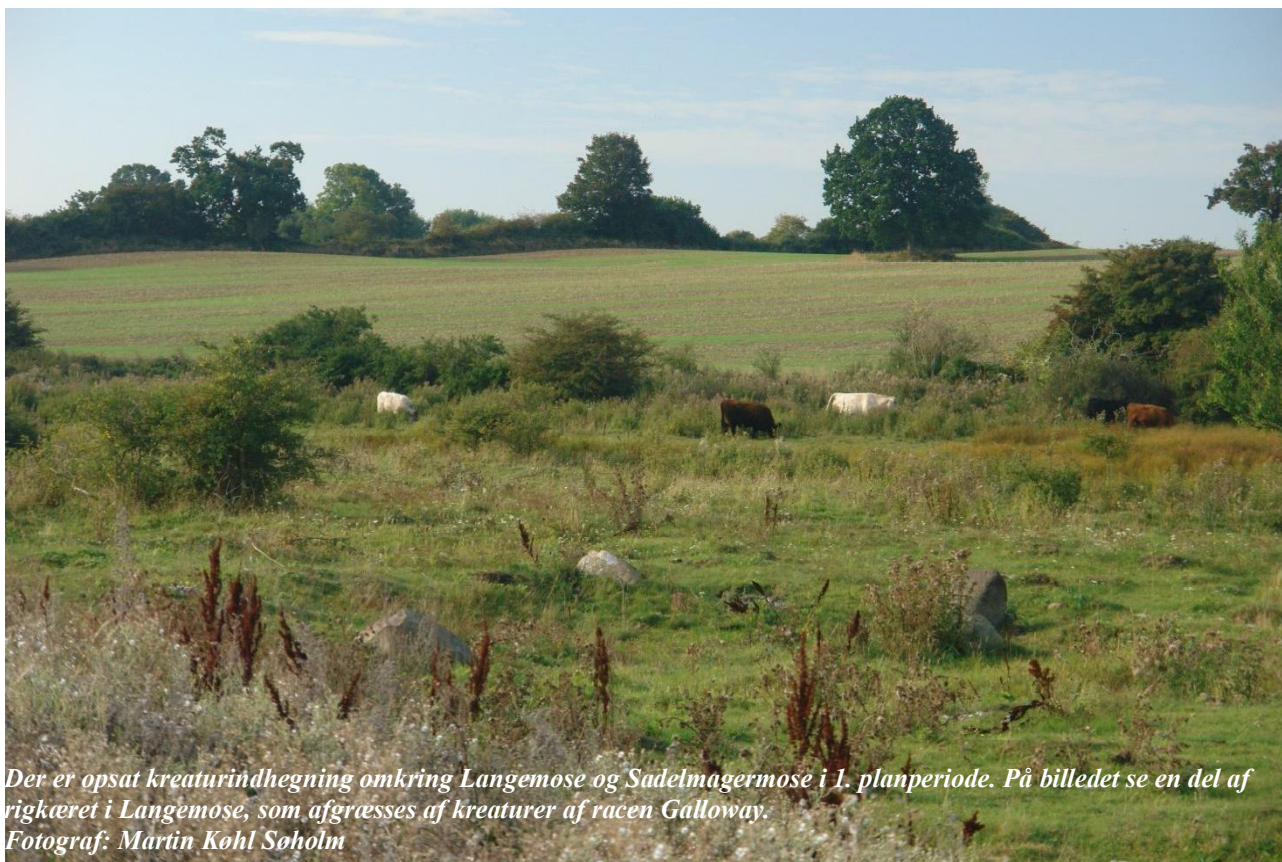
Der er opsat kreaturindhegning omkring Langemose og Sadelmagermose i 1. planperiode. På billedet se en del af rigkæret i Langemose, som afgræsses af kreaturer af racen Galloway.

Indsatsen udføres af lodsejeren i området og gennemføres i videst muligt omfang gennem frivillige aftaler. Der findes blandt andet en række tilskudsordninger, som kan søges gennem NaturErhvervstyrelsen.